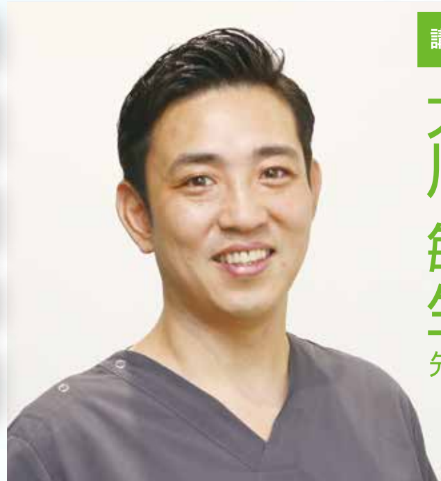
大川歯科医院 院長 JIADS ペリオコース常任講師